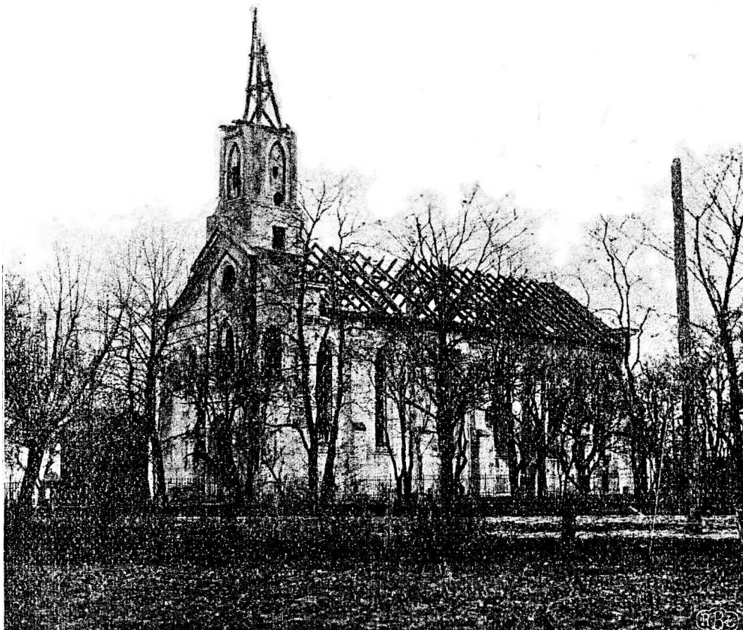
Die evang.-lutherische Kirche in Iłow nach der teilweisen Zerstörung im [1.] Weltkrieg

Verheerungen des nordischen Krieges (1700-1721) erholten sich zusammen mit den heimgesuchten polnischen Landen auch die deutschen Siedlungen. Langsam erstarkten sie wirtschaftlich, der junge Nachwuchs hielt Ausschau nach neuen Niederlassungsmöglichkeiten.